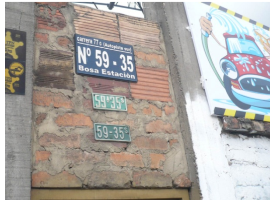
Fotografía 2. Placa de la dirección del predio.