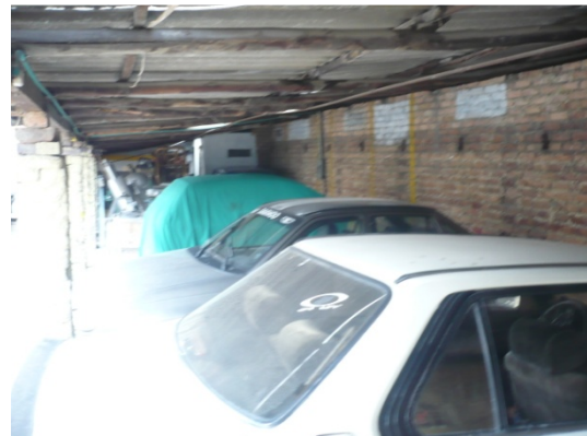
Fotografía 3 y 4. Interior del predio donde opera actualmente un parqueadero.

En cuanto al cumplimiento del requerimiento con radicado No. 2013EE150878 de fecha 7 de noviembre de 2013, la empresa Proditin Ltda., remitió la información