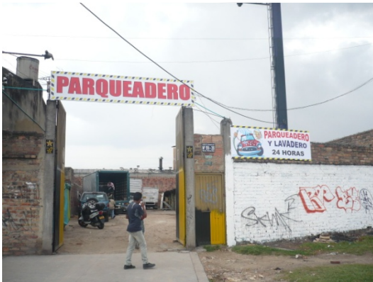
Fotografía 1. Fachada del predio